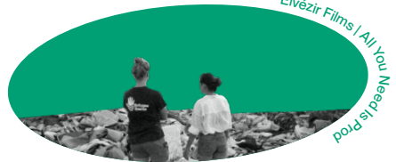
Elvèzir Films | All You Need Is Prod