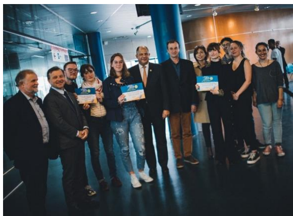
Remise des prix aux lauréats de la « Semaine du Développement durable »