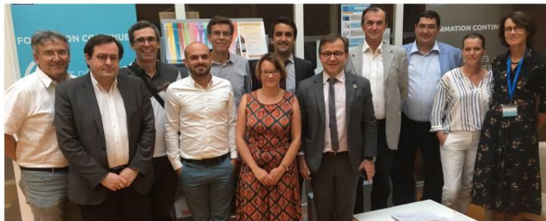
Réunion du conseil de gestion, juillet 2019