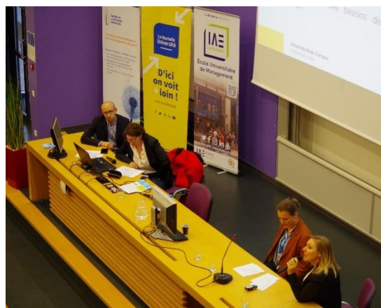
Conférence Université mode d'emploi

Cette manifestation a pu être réalisée grâce au travail et à l'implication, aux côtés de la Fondation, de nombreux services de l'Université : Cabinet, Coordination Relations Socio-économiques, Direction de la Communication, Direction de la Recherche Partenariats Innovation, Institut d'Administration des Entreprises, Pole Formation Continue, Pole Orientation Insertion, Référents filières, et Service des Pédagogies Innovantes.