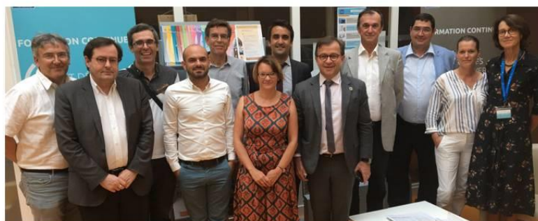
Réunion du conseil de gestion, juillet 2019